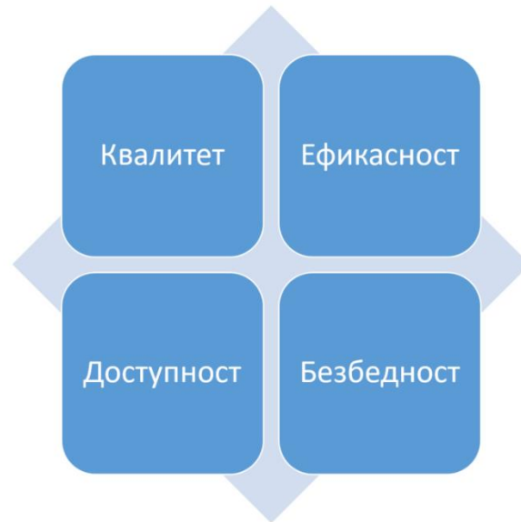
Илустрација 1 Компоненте општег циља дигитализације у здравственом систему

Дигитализација здравственог система и безбедно коришћење услуга и технологија за квалитетнију, ефикаснију и доступнију здравствену заштиту